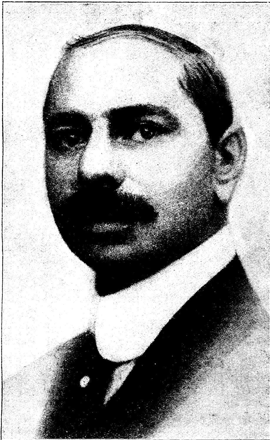
Marcus Loew (Massengründer amerik. Lichtspieltheater).

so eindrucksvoll wie nur möglich. Christliche Geistliche sind, wie jeder Kinobesucher bestätigen wird, jeder Art Herabsetzung ausgesetzt, von der lächerlichen Figur bis zum gewöhnlichen Ver-