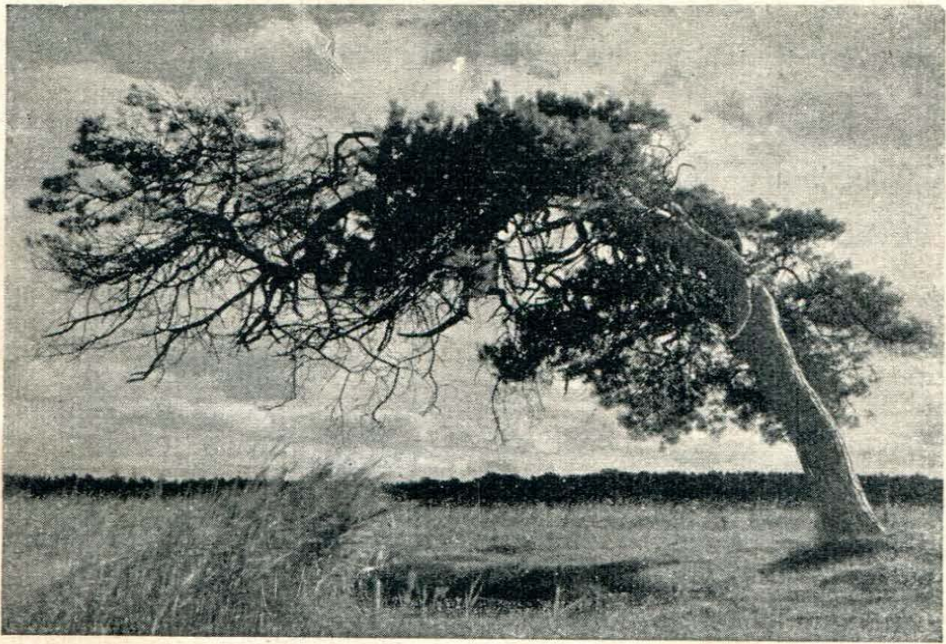
Windflüchter an der Ostsee